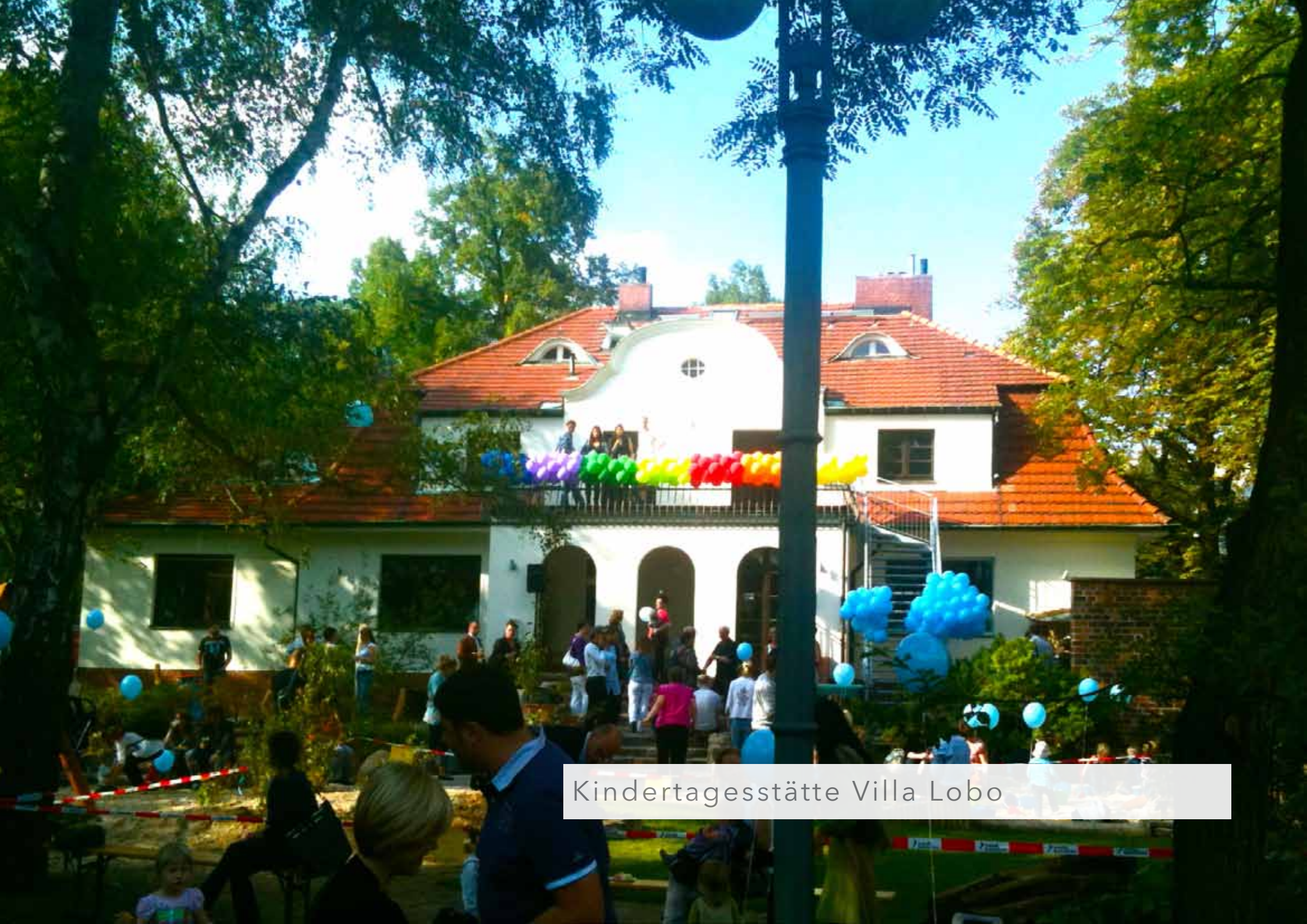
Kindertagesstätte Villa Lobo